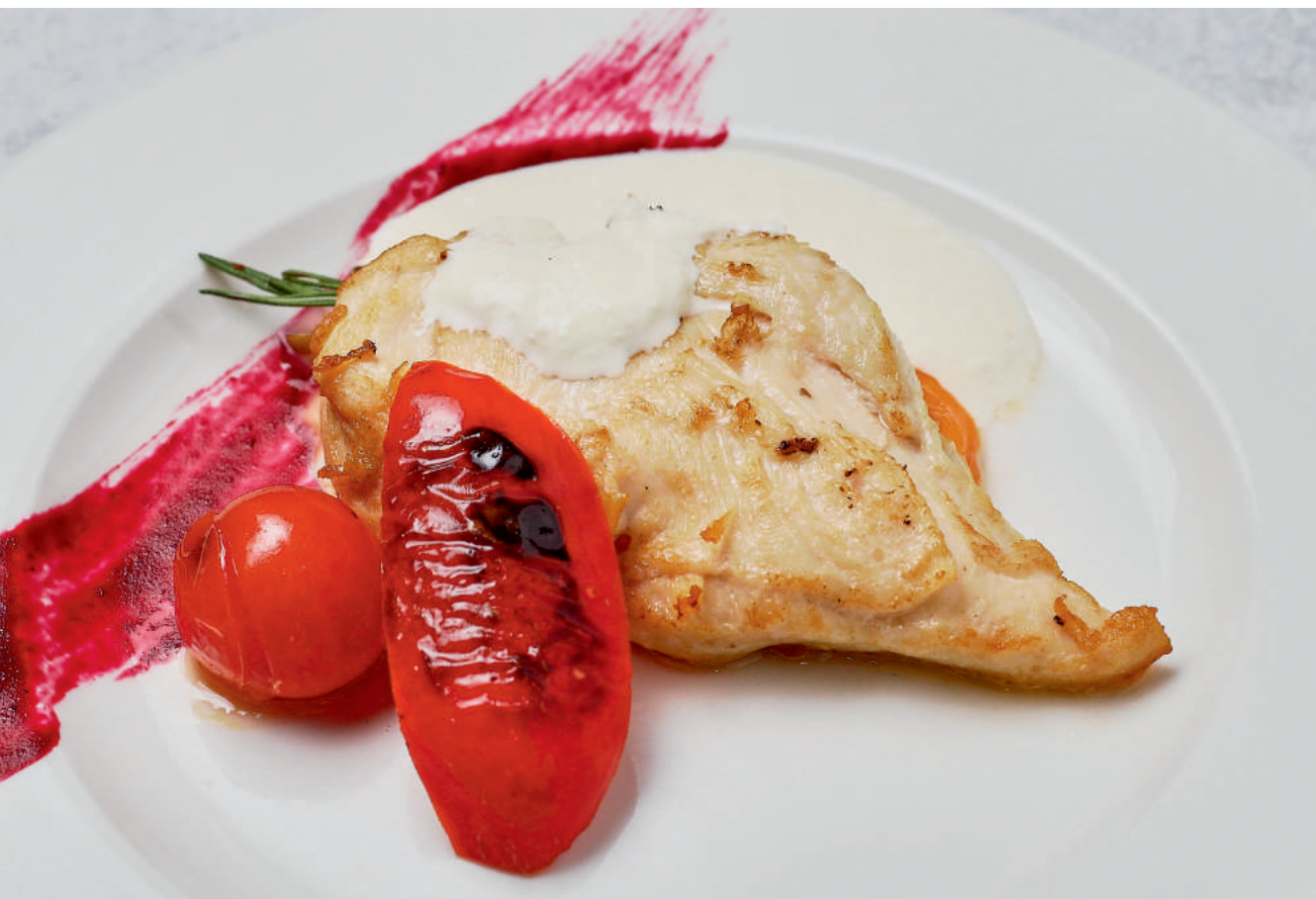
Куриная грудка, фаршированная грибами и грудинкой | 280 гр | 450 гр

Подается с салатом из печени хрустящих овощей