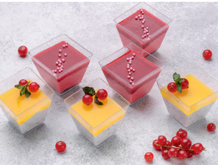
Кокосовая Панна Котта | 50гр | 120 р с семенами чиа и желе из манго