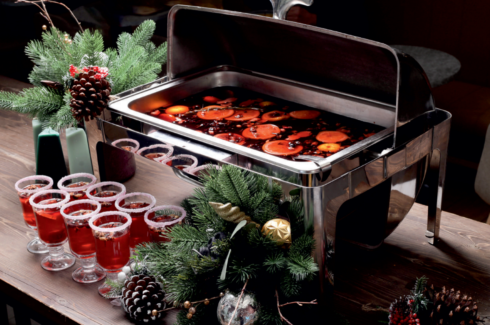
Глинтвейн Лимонады Морс