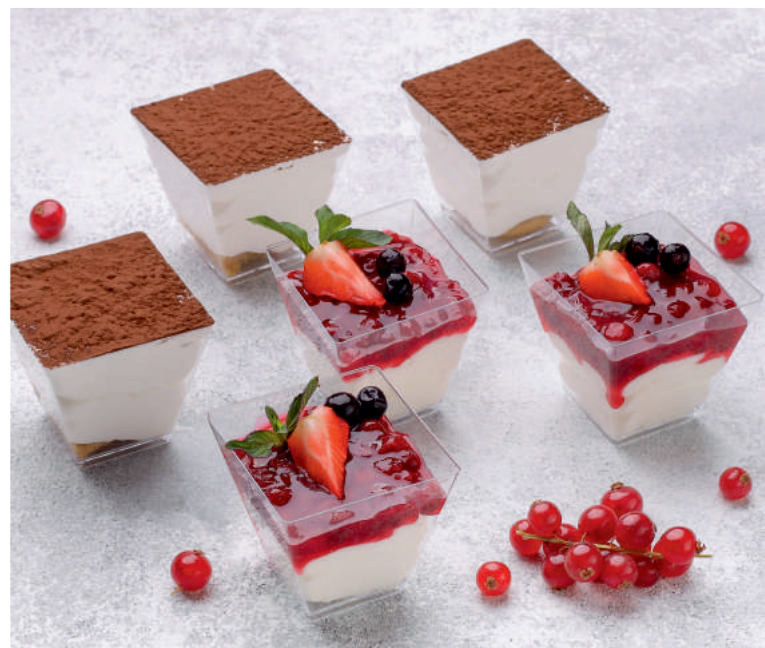
Десерт Тирамису | 50гр | 110 р