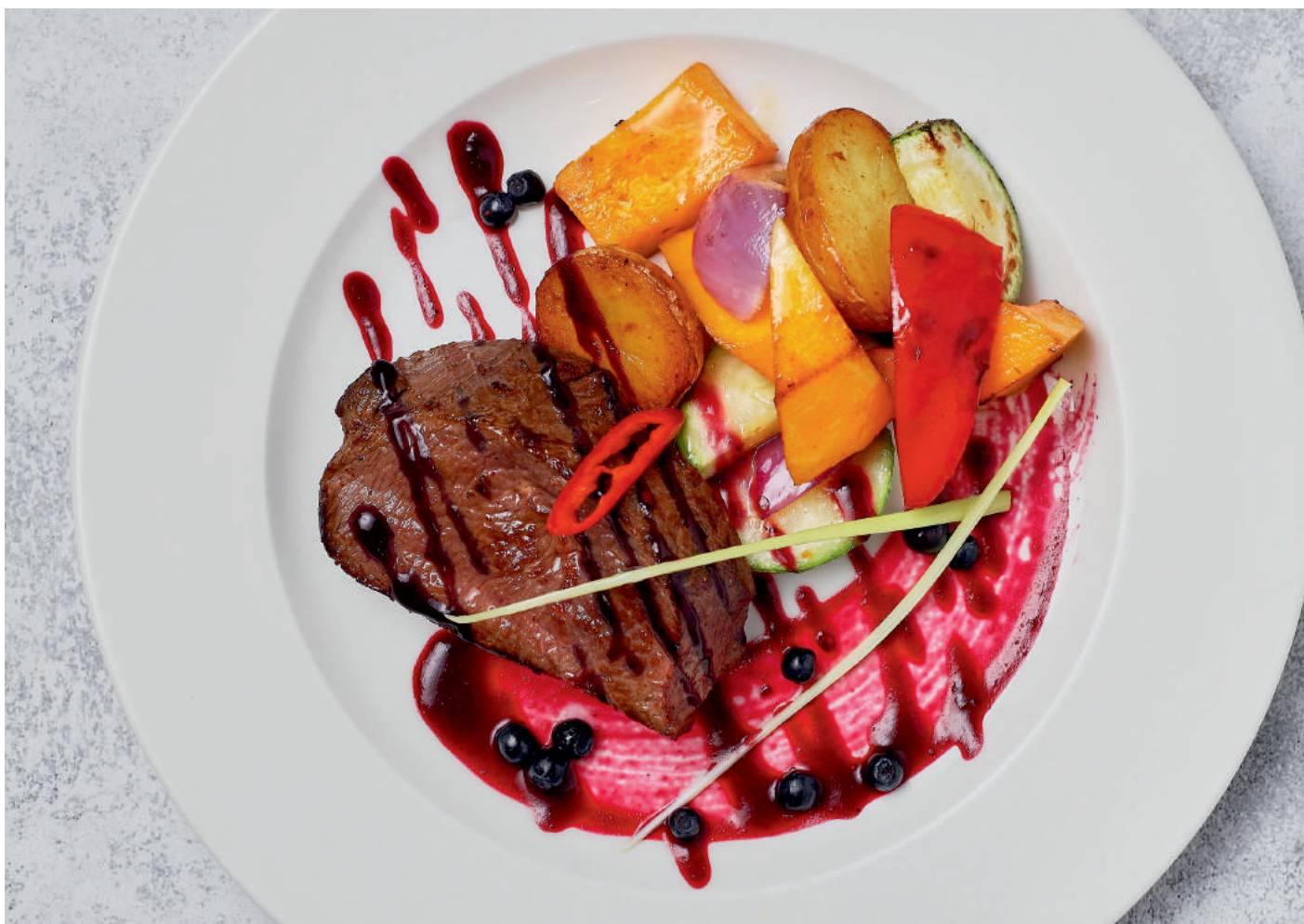
Медальоны из телятины под соусом Деми Глясс | 250 гр | 1100 гр

Подается с салатом из печени хрустящих овощей