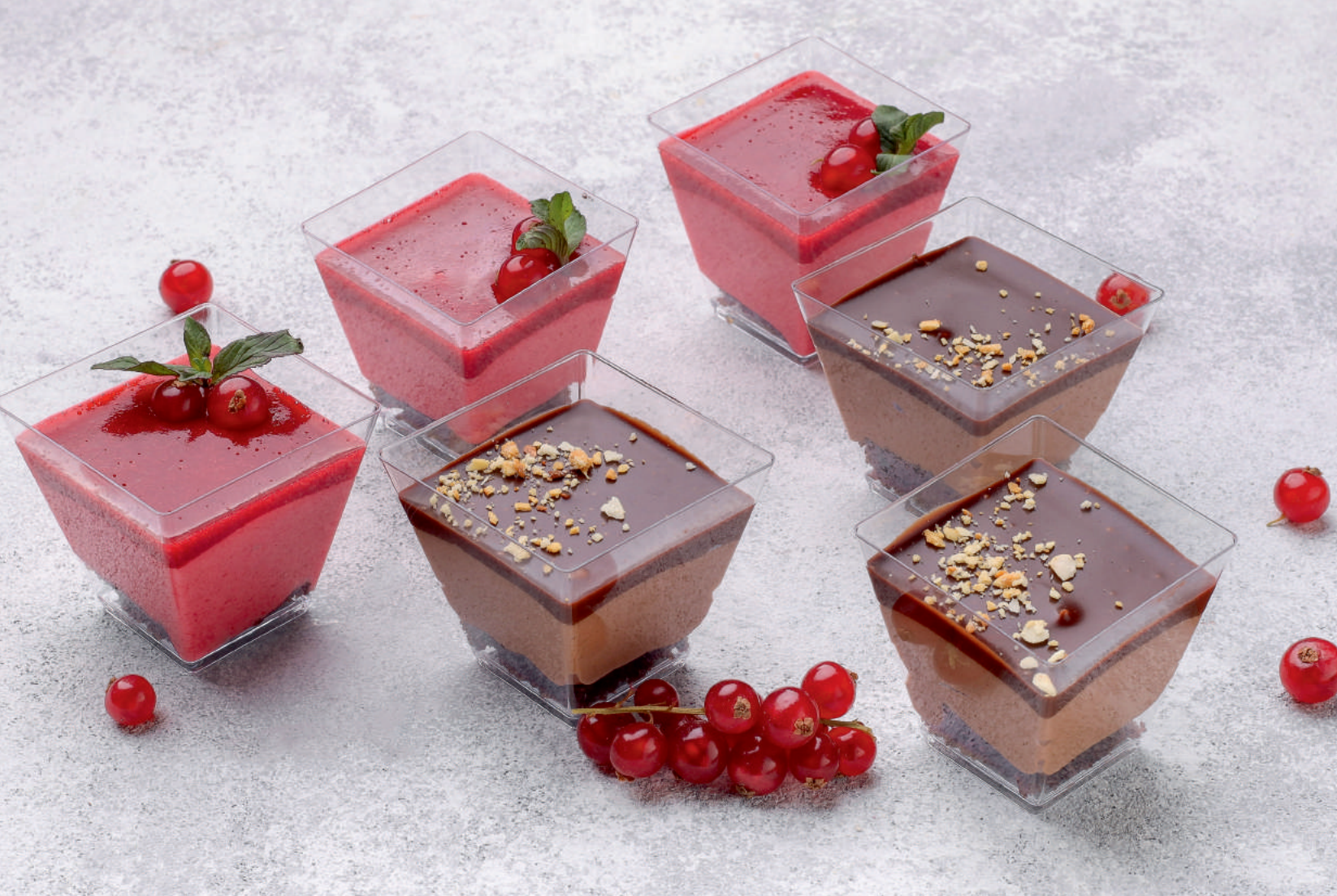
Малиновый мусс | 50гр | 150 р с украшением из ягод