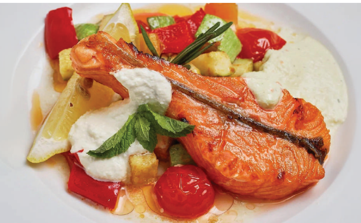
Лосось стейк на углях с лимоном и маринованными цукини гриль | 200 гр